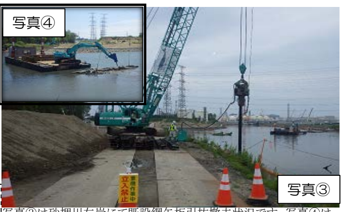
写真② 写真③は砂押川左岸にて既設鋼矢板引抜撤去状況です。写真④は砂押川右岸側の大代水門跡を取り壊し撤去を行っております。※インターネット利用で工事の状況が見れます。ページURL http://www.gembaroid.net で ID:hc0802、パスワード:998633を入力ください。(AM 9:00 ~PM 5:00)