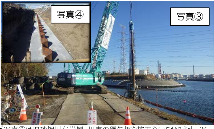
写真③は旧砂押川左岸側、川表の鋼矢板を施工をしております。写真④は砂押川右岸における川裏の鋼矢板打込み完了の写真となっております。※インターネット利用で工事の状況が見れます。ページURL http://www.gembaroid.net で ID:hc0802,パスワード:998633を入力ください。(AM 9:00 ~PM 5:00)