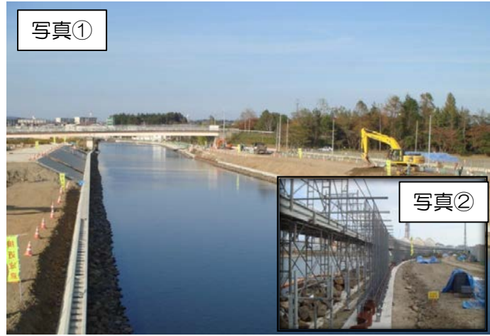
貞山運河では盛土と法面被覆工を開始し、旧砂押川では法面被覆工を継続しています。砂押川では捨石工と特殊堤（壁堤防）構築を継続しています。