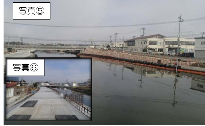
旧砂押川C工区（橋本橋～真園橋間左岸）は、真園橋方向より天端被覆工の施工を行っています。A工区は、堤脚水路工を行っています。E工区船溜まり場については、本設矢板を完工し、構築物取壊しを行っています。F工区は、本設矢板打込み完工しまして基礎コンクリートを行っています。連日片側交互通行のご協力ありがとうございます。