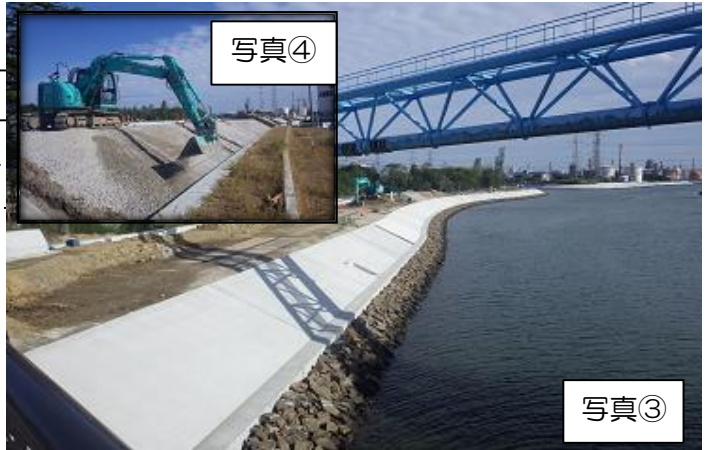
写真③は砂押川左岸側の堤防被覆コンクリートの施工状況です。川表側の下段が終了し、現在上段の施工を行っております。写真④は砂押川右岸側の川裏で堤防の基礎砕石の施工を行っております。