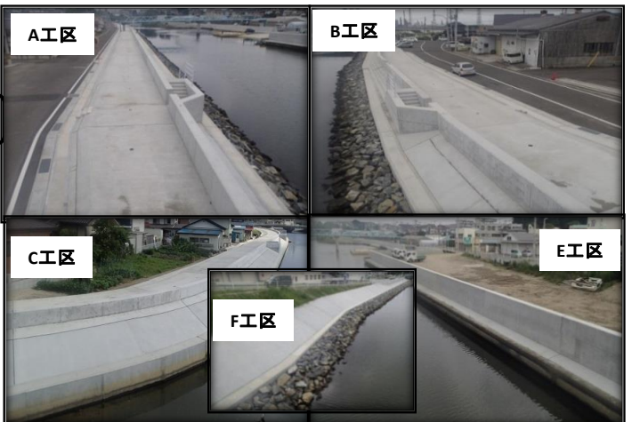
旧砂押川A・B・C・E・F工区の施工が近隣住民様の御協力の元、平成28年6月30日にて無事工事を完成することが出来ました。平成26年5月より2年間多大なご迷惑、ご不便をお掛けしました。ありがとうございました。