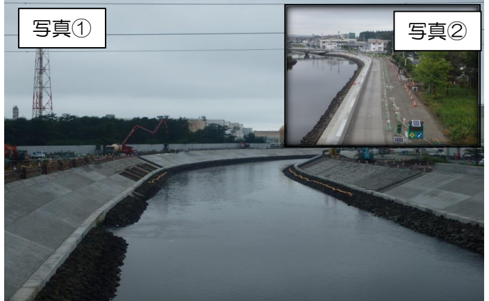
砂押川、貞山運河、旧砂押川の各所にて、新護岸としての被覆工と壁構築を継続で進めています。多賀城市道においては、片側交互通行にて道路側溝工事を継続で行っております。