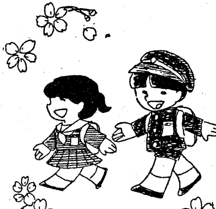
新入学児童を交通事故から守りましよう