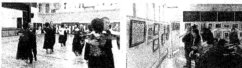
上記写真は、平成24年度実施した大代地区公民館まつりの様子です。