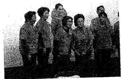
踊りを披露した第1百寿会の皆さん