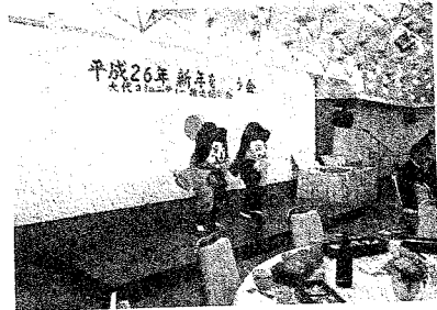
第2百寿会の皆さんによる仮装踊り