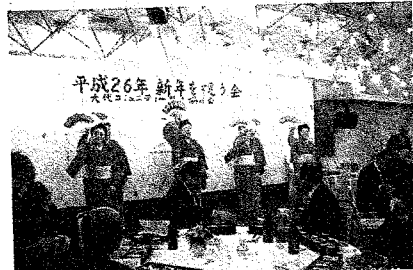
祝宴の舞を披露する暁流の皆さん