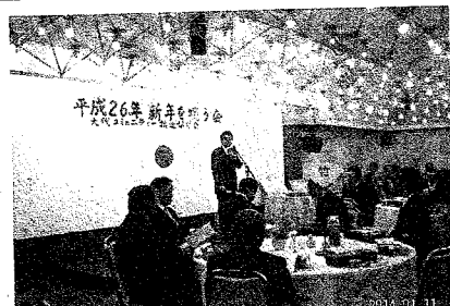
参加者の皆さんに挨拶する熱海会長

情報の発信や講座の実施など地域の方々にとって利用しやすい公民館となるよう各種事業を行って参りたいと思っておりますので、皆様方のご協力を宜しくお願い申し上げます。