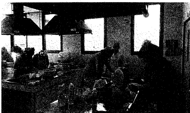
5月24日(土)中国家庭料理教室 中国出身の講師から、本場中国料理について熱心に学ぶ受講者の皆さん

さて、始まったばかりの中、いくつかの事業を行いましたので、報告させていただきます。公民館は社会教育事業というものを実施します。市民の方を対象とした事業です。これも指定管理の業務の一環です。