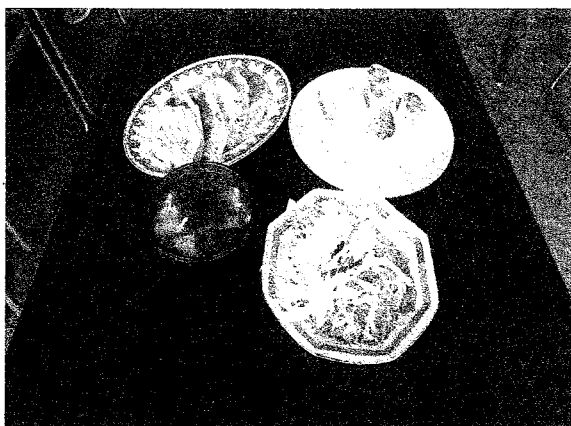
写真右上がシュンピン(春巻きのようなもの)、左上がクワッツ(餃子のようなもの)です。

5月24日(土)は中国家庭料理教室を開催しました。中国の講師による中国の家庭料理を作りました。身近に感じる中国料理ですが、実際に中国の家庭などで食している料理で、合子(クワッツ)、春餅(シュンピン)、サラダ、スープを調理しました。