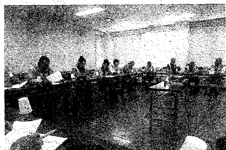
講話を聴く、研修会参加者の皆さん

私達防犯協会も、まず取り込めるものから犯罪のない地域、明るい地域を目指して活動して行くことを決意し帰宅しました。