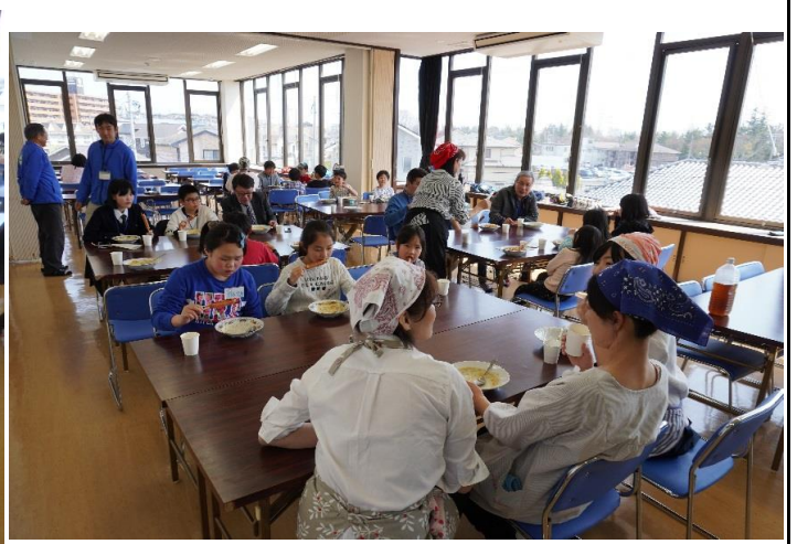
まなびのひろば (4月4日・5日)