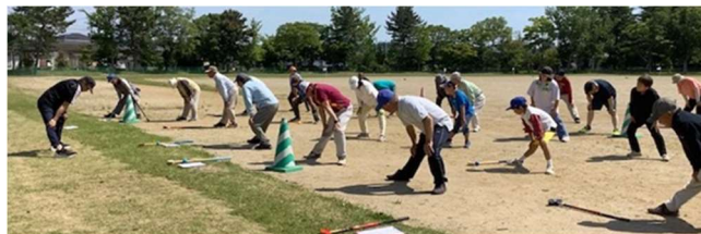
準備運動は大切です

ご家族、ご近所、腕自慢、たくさんの地域の方々と楽しむことができ、笑顔いっぱいになりました。次回は8月3日を予定しています。