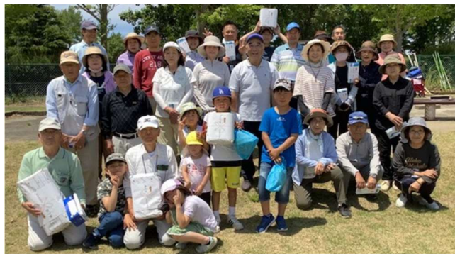
閉会式後に、皆笑顔で、ハイチーズ!