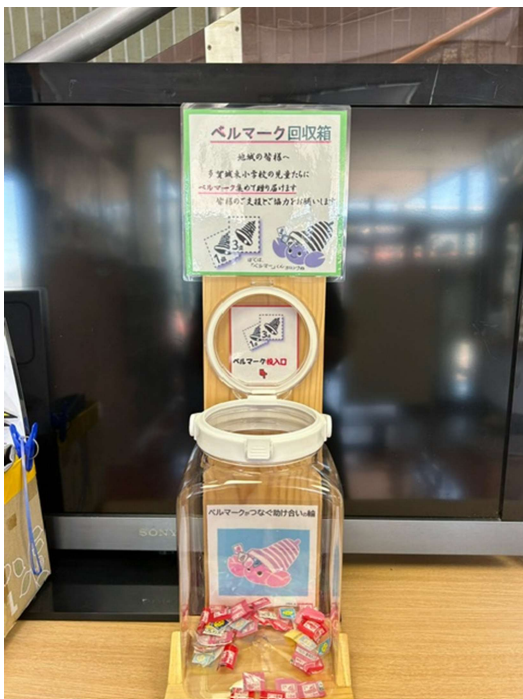
大代地区公民館玄関正面に設置しています

大代地区公民館に下記の写真の回収ボックスを設置しますので、公民館にお越しの際は、ご自宅にあるベルマーク収集のご協力をお願いいたします。