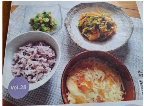
健康にも良い、おいしいメニューです

古代米入り麦ごはん、厚揚げのしゃきっと南蛮漬け、山形風だしトマトとエノキのスープを予定通り調理することが出来ました。