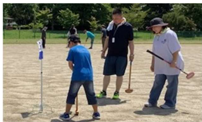
初めてですがとても上手です