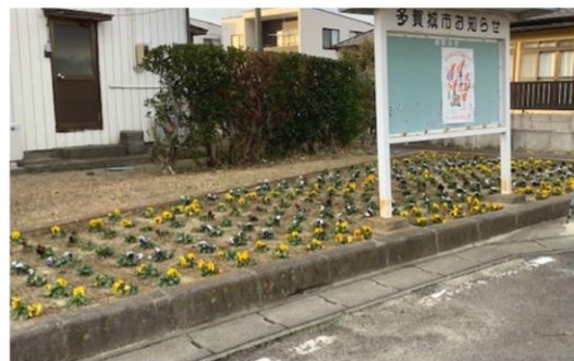
大代中町内会 大代橋下北側の花壇 3色(黄・紫・白紫)のパンジー