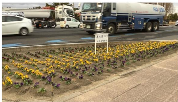
大代西町内会 多賀城駐屯地前の花壇 3色(紫・黄・赤)のパンジー

冬から春にかけて、町内会に彩りを添え、心とませてくれる4つの花壇。その様子を写真で紹介します。