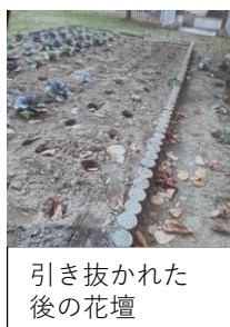
引き抜かれた 後の花壇

大代南町内会の花壇は、「ふれあい花壇」です。この「ふれあい花壇」に、11月に葉ボタンを植えてすぐ、悲しい出来事が起きました。葉ボタンが、引き抜かれていたのです。引き抜かれた葉ボタンは、枯れてしまったので、役員の皆さんが、すぐに別の葉ボタンを植えて、現在は、上の写真のように葉ボタンが咲いています。二度と引き抜かれることがないように祈るばかりです。