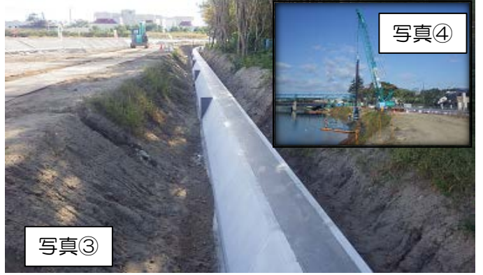
写真③は旧砂押川左岸側の川裏基礎コンクリーを施工をしております。写真④は砂押川左岸における鋼矢板打込み作業状況です。※インターネット利用で工事の状況が見れます。ページURL http://www.gembaroid.net で ID:hc0802、パスワード:998633を入力ください。(AM 9:00 ~PM 5:00)