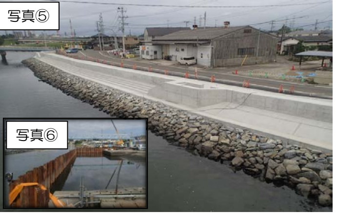
旧砂押川C工区(橋本橋～貞園橋間左岸)は、貞園橋方向より天端被覆工の施工を行っています。A工区は、大代ポンプ場の内の排水工事を行っています。E工区船溜まり場については、仮設矢板打込みを完工してこれから本設矢板を打込みます。F工区は、基礎部掘削、構造物取壊しを行っています。