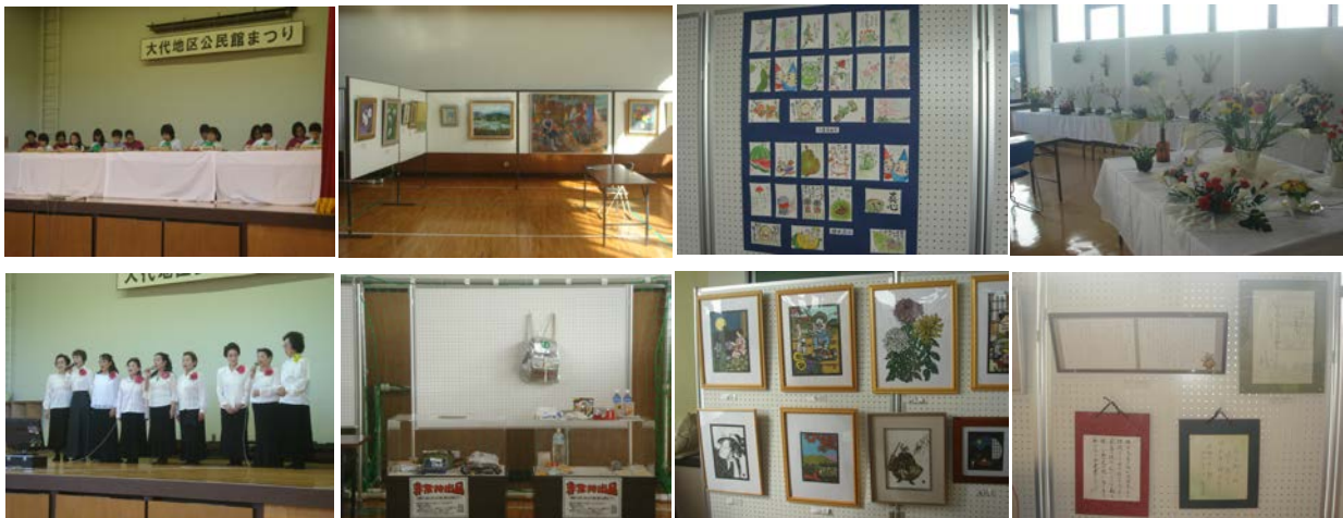
(平成27年度大代地区公民館まつり)

作品展示は、ペン習字、油絵、パンアート、切り絵、はがき絵と、大代地区婦人防火クラブによる火災警報器の展示がありました。 舞台発表は、大正琴、カラオケ、日本舞踊、民謡、剣道、レクリエーションダンス、社交ダンスを行いました。