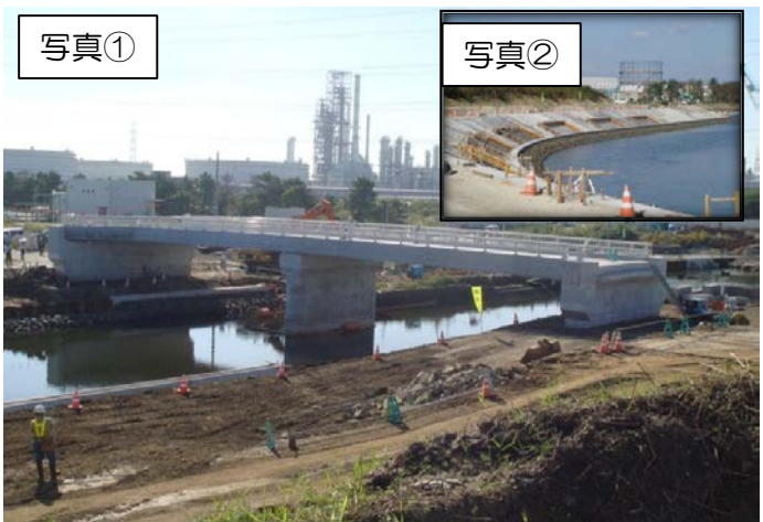
写真① 貞山運河では川表・川裏基礎構築を継続し、旧砂押川では法面被覆工を開始しています。新仙流橋建設においては上部工が完了しています。砂押川では特殊堤構築を開始しました。