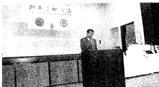
主催者を代表し挨拶する熱海会長