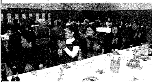
拍手でたたえる参加者の皆さん

コミュニティ推進協議会にとって今年、体制変換準備の年です。皆様方のご意見を伺いながら新たな事業にも取り組んで参りますのでご協力の程宜しくお願い申し上げます。