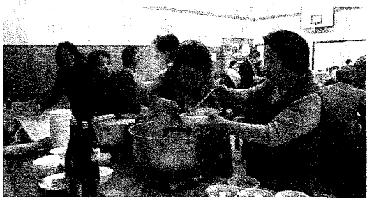
豚汁を振舞う婦人会の皆さん