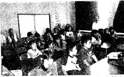
多賀城の歴史について、映像を見ながら講師の説明を聴く子供達

7月24日(水)小学生を対象に歴史講座を開催しました。参加者は小学生19名と地元の協力者8名でした。内容は、多賀城の成り立ち、生活の様子などを学習した後、火起こし体験や、石碑の紙模型作りなどを実施しました。特に火起こしは、みんなで体験し、難しさ、昔の人の考え方の偉大さを実感していました。