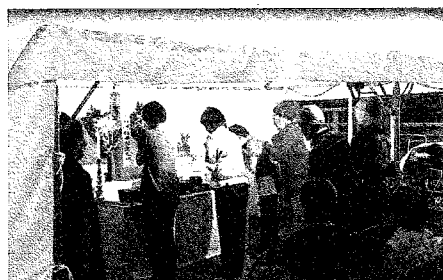
焼香し祭壇に手を合わせる地元の皆さん