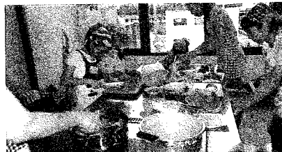
子供達も教わった手付きで上手に調理をしました。

7月31日(水)親子を対象に夏バテ予防料理教室を開催しました。参加者は親子7組の17名でした。今回のメニューは、夏でも食欲が湧くように、具たくさん冷麺、オクラスープ、白玉フルーツポンチを作りました。学校給食センターの栄養士さんの説明があった後、グループ毎に分かれて料理を作り、できあがった後は、みんなでテーブルを囲み、昼食会を楽しみました。