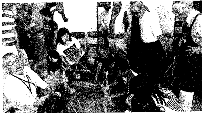
火起こし体験、なかなか火が点かず、力を入れて火起こしを試す子供達