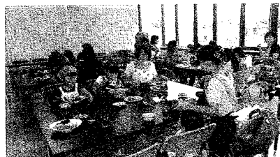
会話を弾ませながら、自分達で作った料理を味わう参加者の皆さん

これからも、地域の皆さんに楽しんで頂ける講座を企画してまいりますので、ご参加ください。お願いします。