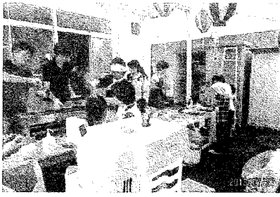
東区集会所での開催となりましたが、各役員の方々が協力して祭りを盛り上げました。

今回は、残念ながら盆踊りの輪はできなかつたようですが、子供達の和、町内会役員の方々そして子供会の皆さんの和は大きく広がったものと感じられました。害虫も悪神も来ない素晴らしい地域になるだろうと思えました。