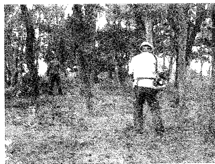
自由に散策できるようにとの思いで、除草作業を実施しました。

県頼みではなく、少しでも住民の力で、自分達ができる範囲で行動しませんか・・・力を頂く皆さんから伝わってきた思いです。