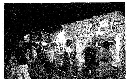
出店の前で買い物を楽しむ家族連れ