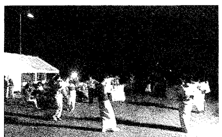
盆踊りを披露する暁流の皆さん